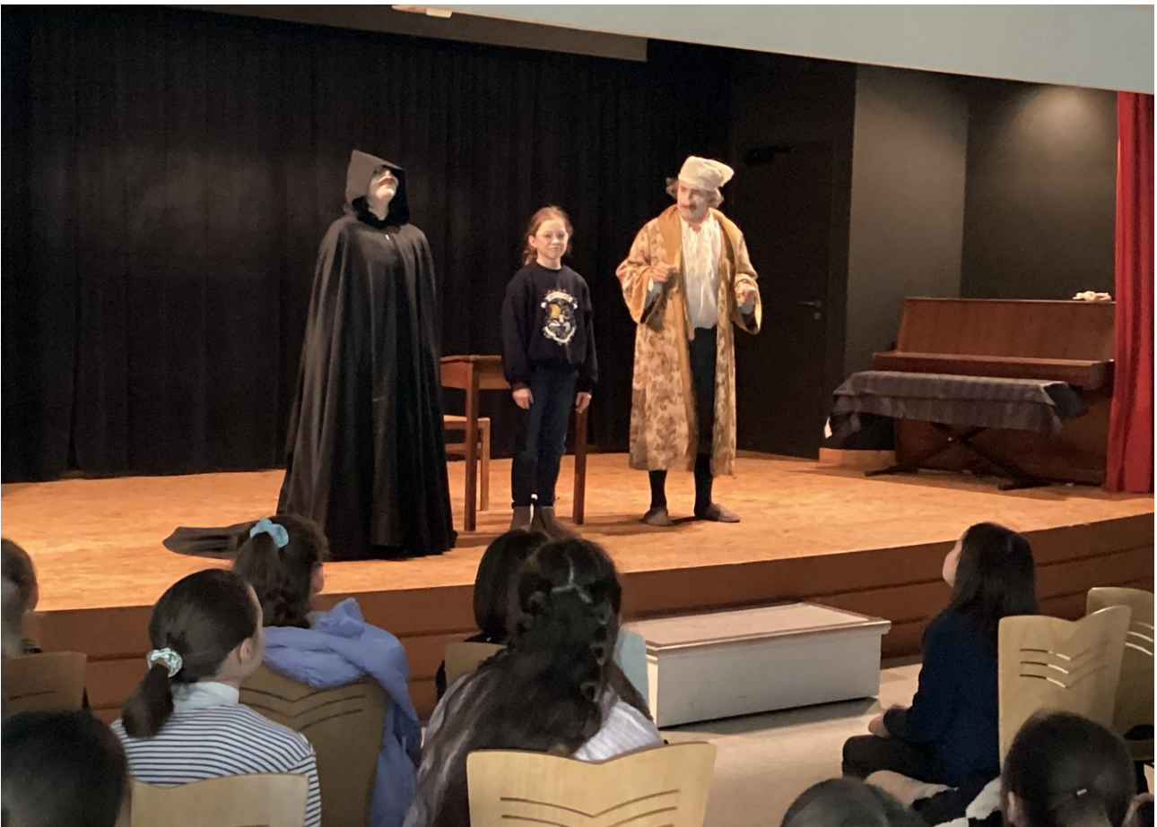
Représentation scolaire - Lycée Saint Joseph à Janzé (35)

Les scènes sélectionnées, le monologue d'Argan et ses 'drelins' et les 'ah' de Toinette, sa servante, nous présentent bien la naïveté d'Argan. La suffisance, la pédanterie, le verbe fumeux, en un mot l'étalage de la Médecine propre à l'esprit de Molière est démontré lorsque Toinette, à la scène suivante, est déguisée en médecin et trompe royalement son maître.